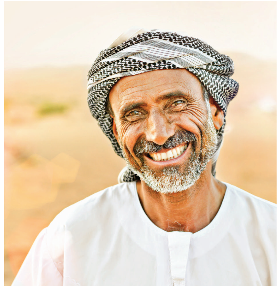
VEREINIGTE ARABISCHE EMIRATE

IHRE HEIMATLÄNDER BESITZEN GIGANTISCHE STAATSFONDS.